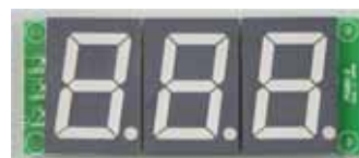
基板単体 40mm高3桁の例