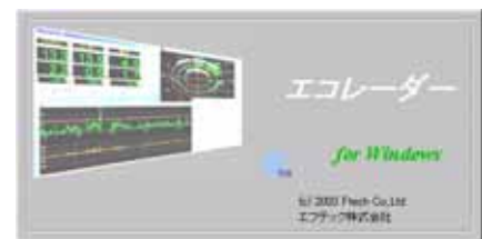
データ収集アプリケーション「エコレーター」